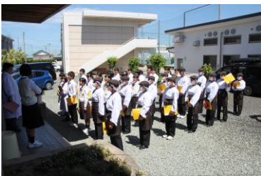
▲初めての実習に臨む 食品デザイン科の新入生

今年度の食品デザイン科の実習服(調理服)の色は 1年生:ブラウン 2年生:グリーン 3年生:ワイン ...と、学年ごとに色分けされています。デザインも高校の実習用調理服としてはとてもお洒落だと評判になっています。