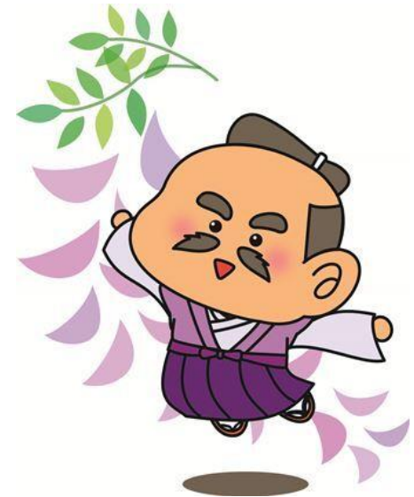
大洲高校マスコットキャラクター とうじゅくん