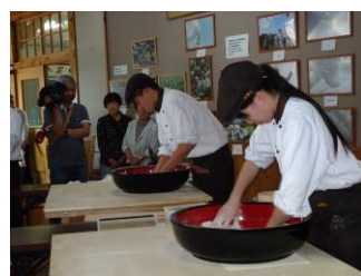
▲そば打ちを披露するメンバー