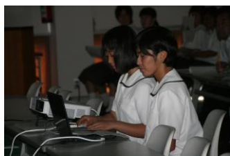
▲プロジェクト発表の様子

また、6月下旬には、各学科ごとに、農業鑑定競技の代表選考会も実施されました。農業鑑定競技とは、各学科で学ぶ専門的な用語・実物についての知識や鑑定眼を競う競技です。学校の代表がそのまま全国大会に出場できるため、最も全国大会に近い競技とも言えます。予選は所属学科ごとに、生徒全員が参加して行われました。