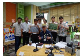
▲放送後の記念撮影!