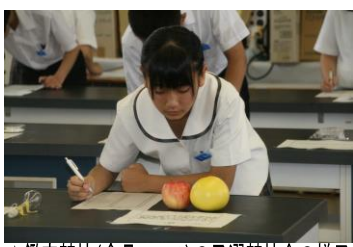
▲鑑定競技(食品コース)の予選競技会の様子