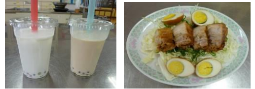
アジア料理校内試食会アンケート結果 32人回答

10月27日（土）11:00～15:00のフレンド祭りでタピオカドリンクのリベンジを図ります。是非、遊びに来てお試してください。