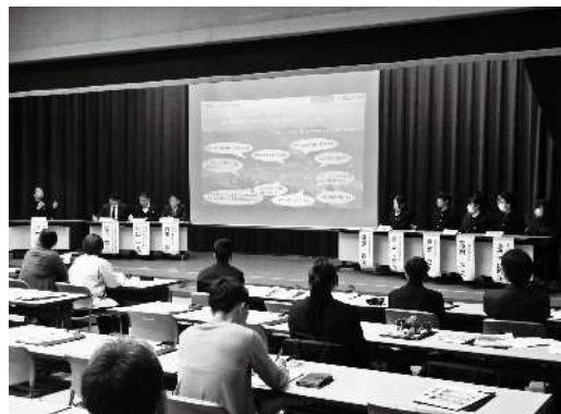
昨年実施した、第1回報告会の様子

※当日は報道が入ります。ご参加の方の声や姿が映る可能性もありますことを、あらかじめご了承ください。